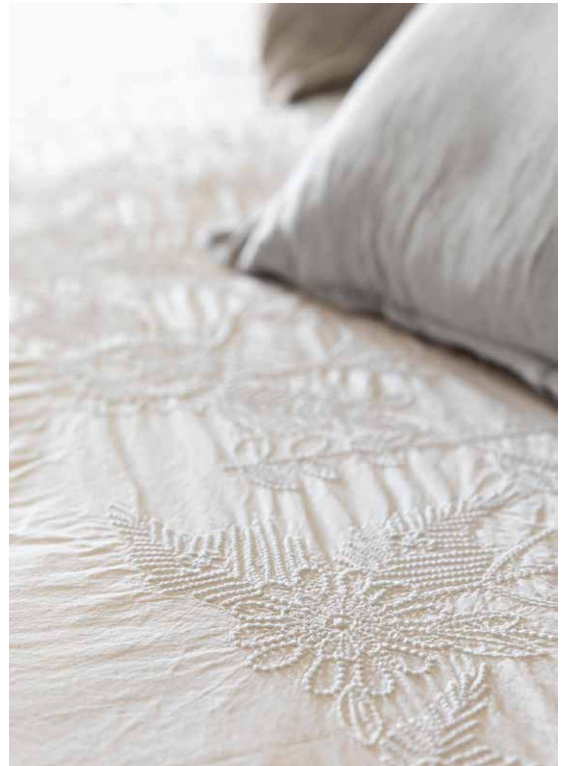
Op het bed ligt bedtextiel van Walra. De kussens zijn van De Bongerd.

“We kopen wat we mooi vinden, wat past en wat goed voelt”