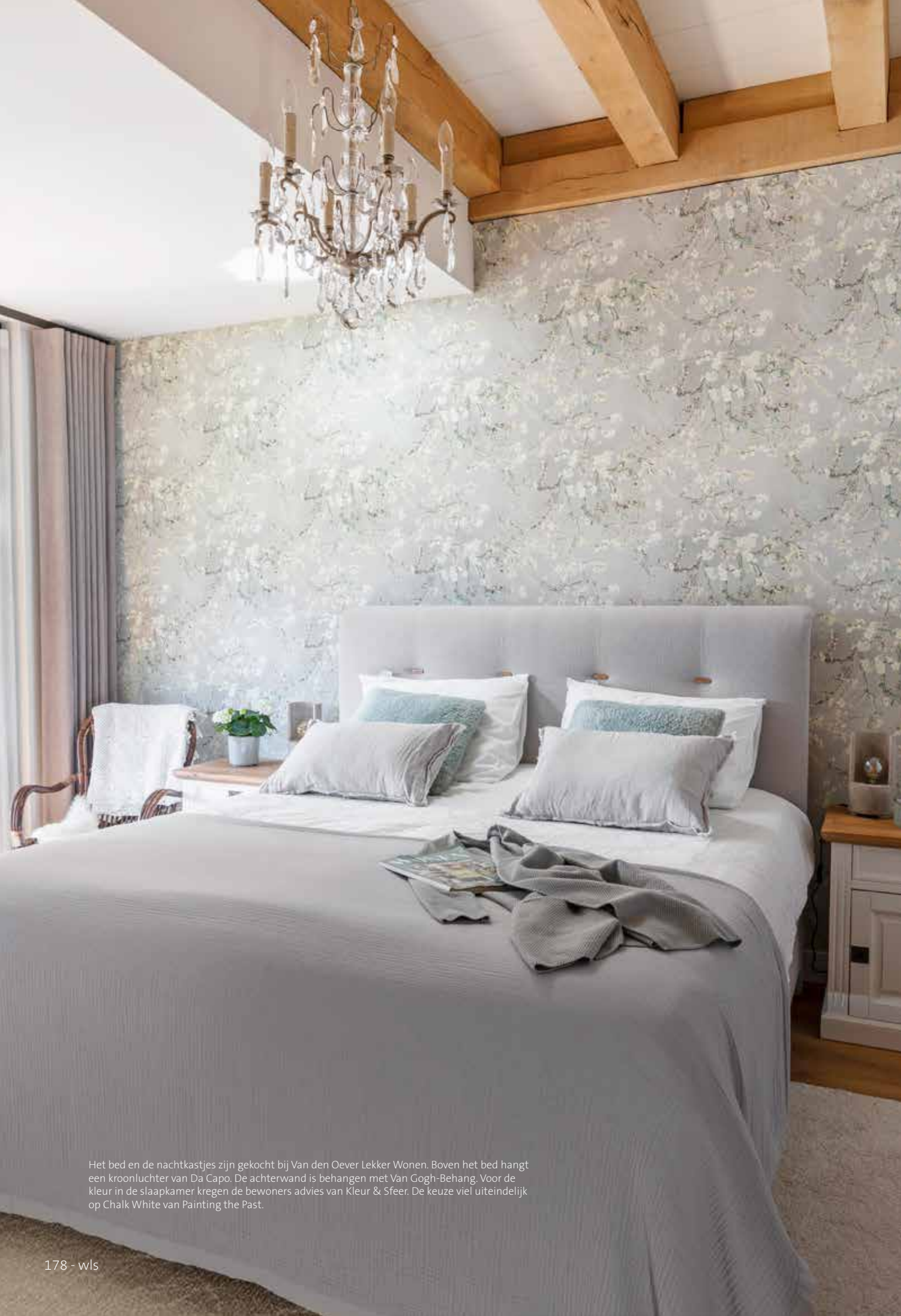
Het bed en de nachtkastjes zijn gekocht bij Van den Oever Lekker Wonen. Boven het bed hangt een kroonluchter van Da Capo. De achterwand is behangen met Van Gogh-Behang. Voor de kleur in de slaapkamer kregen de bewoners advies van Kleur & Sfeer. De keuze viel uiteindelijk op Chalk White van Painting the Past.