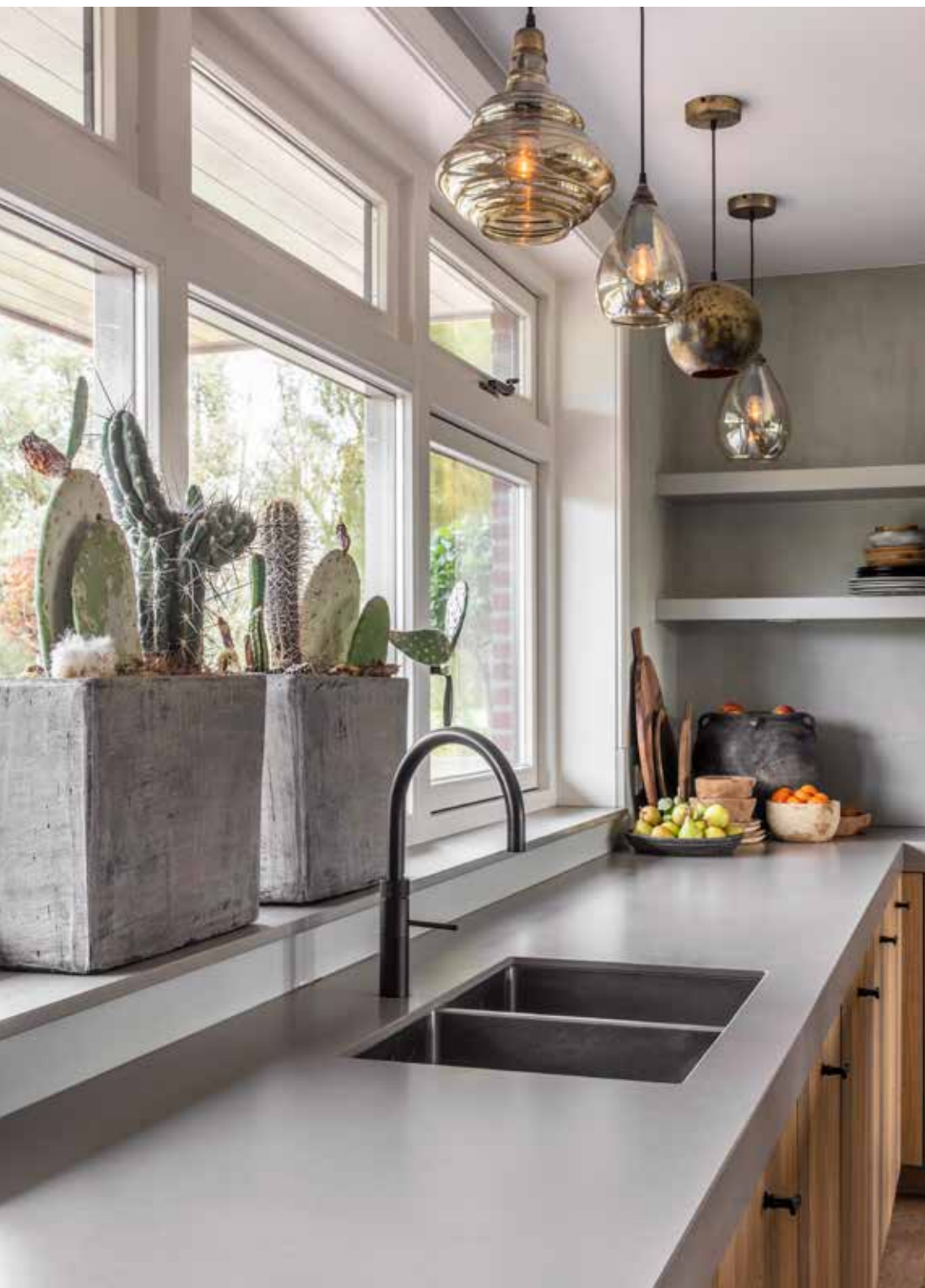
De lampjes van BePureHome boven het aanrecht komen via DutchHome.