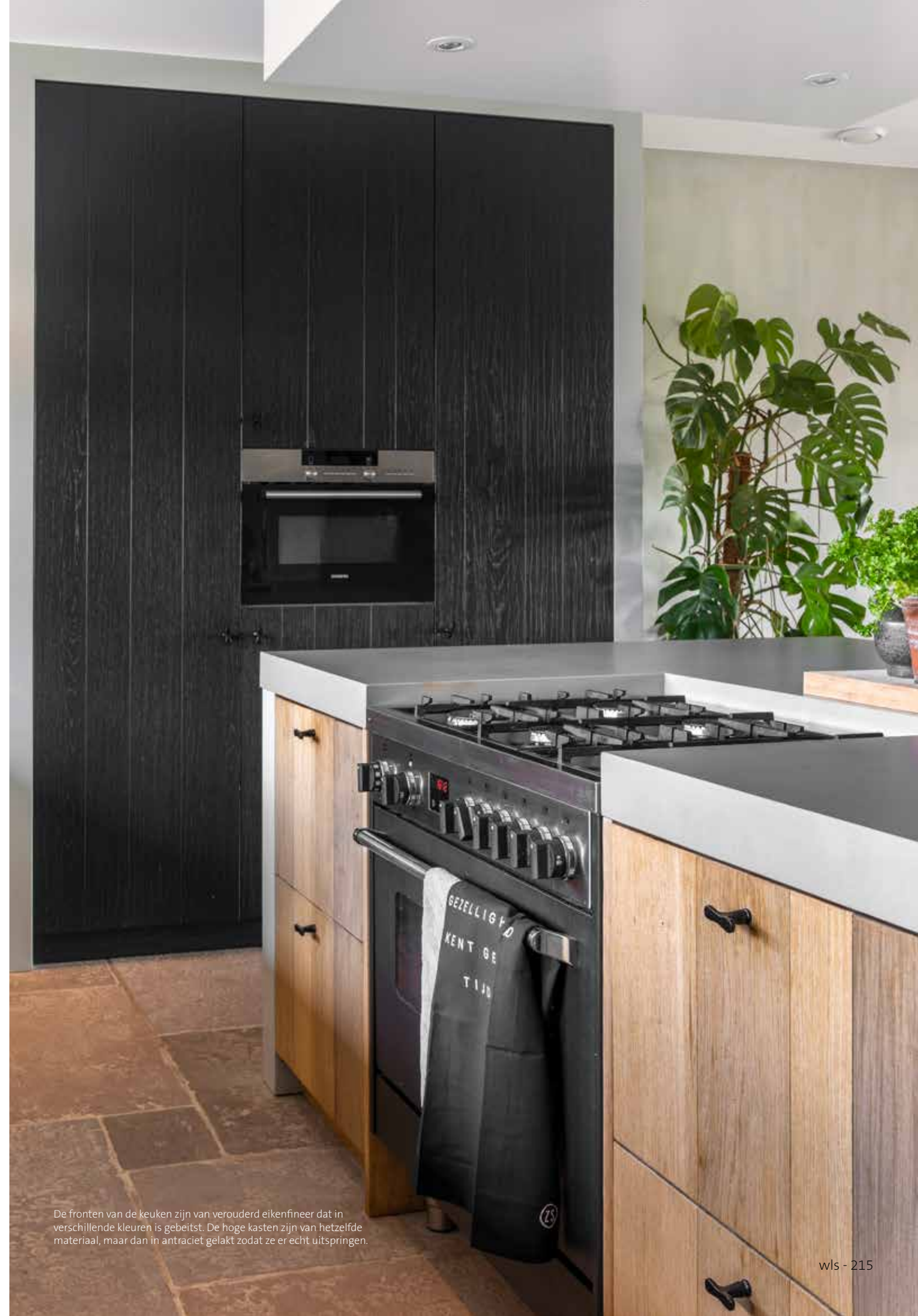
De fronten van de keuken zijn van verouderd eikenfineer dat in verschillende kleuren is gebeitst. De hoge kasten zijn van hetzelfde materiaal, maar dan in antraciet gelakt zodat ze er echt uitspringen.