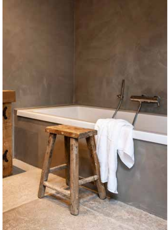
Op de vloer van de badkamer liggen Castle Stones. De wanden zijn door BS Afbouw afgewerkt met beton ciré in de kleur Grigio Scuro. Al het sanitair komt via Jeroen Neuteboom.

“Ik ben blij dat ik naar het advies geluisterd heb om het niet kleurrijk te maken”