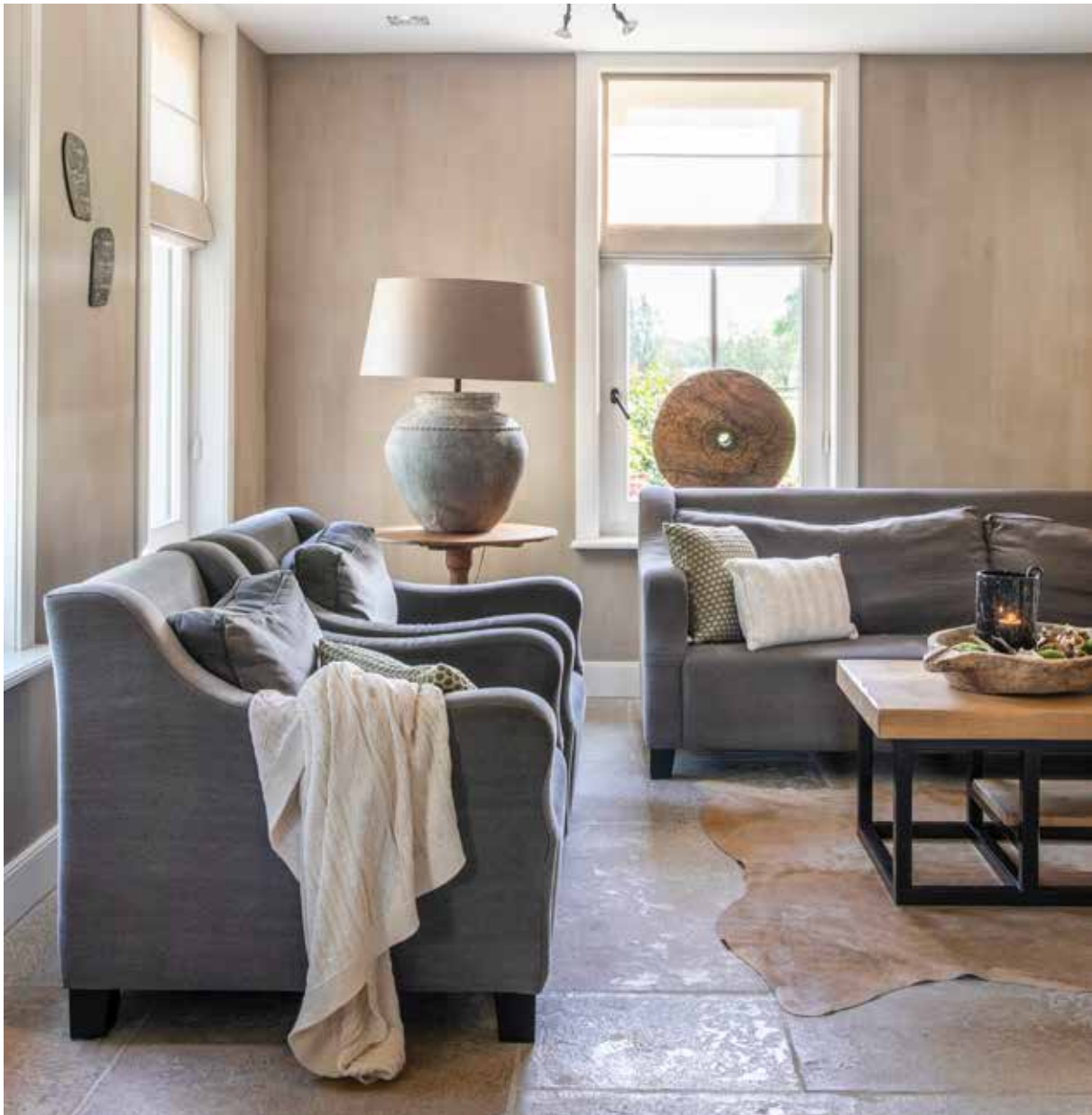
Tekst Yvonne van Galen – Fotografie Denise Zwijnen

AVELINE EN GERT WERDEN HUN EIGEN NIEUWE BUREN: ZE BOUWDEN EEN ANDER HUIS NAAST HUN BESTAANDE WONING. "ALLES IS GEBOUWD ROND ONZE LIEFSTE WENS: EEN GROTE WOONKEUKEN WAAR WE MET ONS GEZIN MET VIJF KINDEREN LEKKER KUNNEN LEVEN", VERTELT AVELINE.