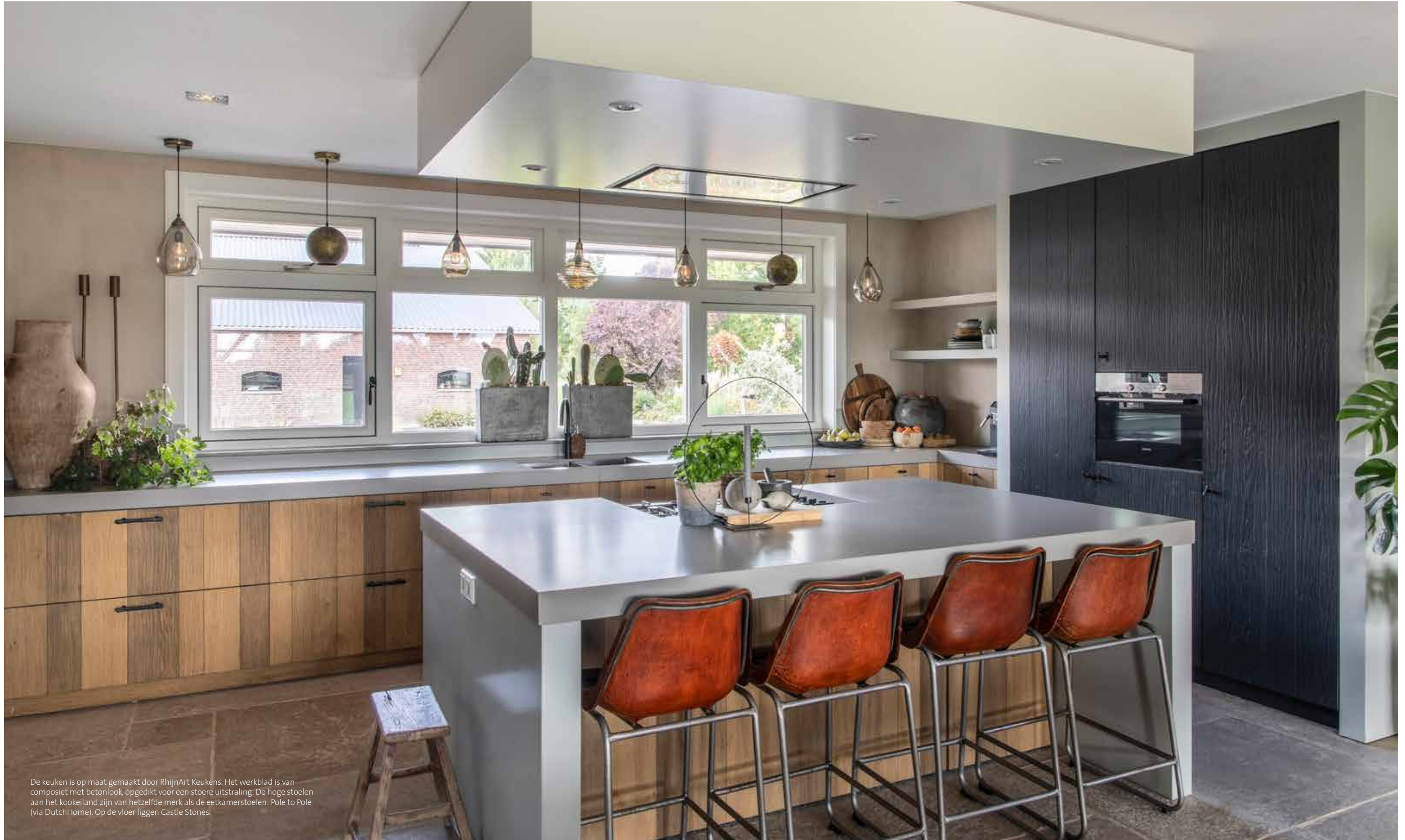
De keuken is op maat gemaakt door RhijnArt Keukens. Het werkblad is van composiet met betonlook, opgedikt voor een stoere uitstraling. De hoge stoelen aan het kookeiland zijn van hetzelfde merk als de eetkamerstoelen: Pole to Pole (via DutchHome). Op de vloer liggen Castle Stones.